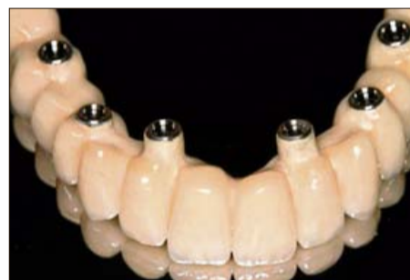
Los avances tecnológicos permiten poner implantes en zonas con poco hueso.